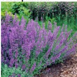
Figuur 2 (Kattenkruid) Nepeta