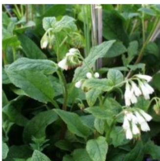
Figuur 5 (Smeewortel) Symphytum