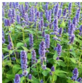
Figuur 7 (Droplant) Agastache