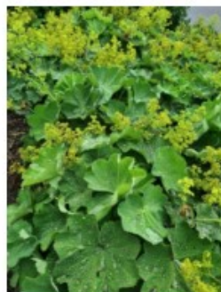
Figuur 4 (Vrouwenmantel) Alchemilla