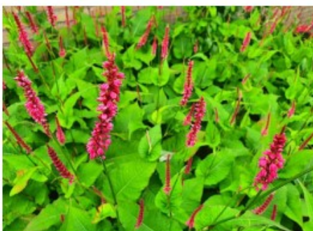
Figuur 6 (Duizendknoop) Percicaria