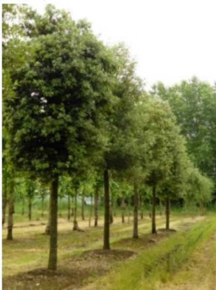
Figuur 1 (Steeneik) Quercus ilex